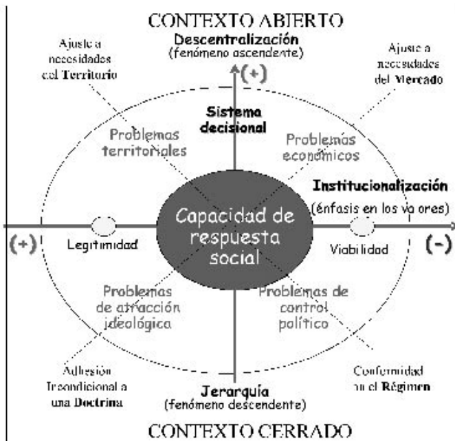
FIGURA 3 Fuerzas de ajuste de la realidad social cooperativa

Así, la doctrina sería la fuerza que nos sitúa ante un cooperativismo dominado o influido por una cosmovisión religiosa o ideológica. El régimen –sistema político dominante– podría encuadrar aquella acción cooperativa donde ésta se convierte en una estrategia para la intervención y control del estado en la vida social y económica. Un tercera fuerza podría venir fundamentalmente del contexto territorial, cultural – y en el que podríamos situar aquél cooperativismo nacido para resolver problemas de una determinada colectividad. Por último, tendríamos los casos en donde son las fuerzas del mercado , ya sea en un papel dominante –concentración monopolista– o dominado –descentralización productiva– las que marcarían el hecho social cooperativo. (Figura 3).