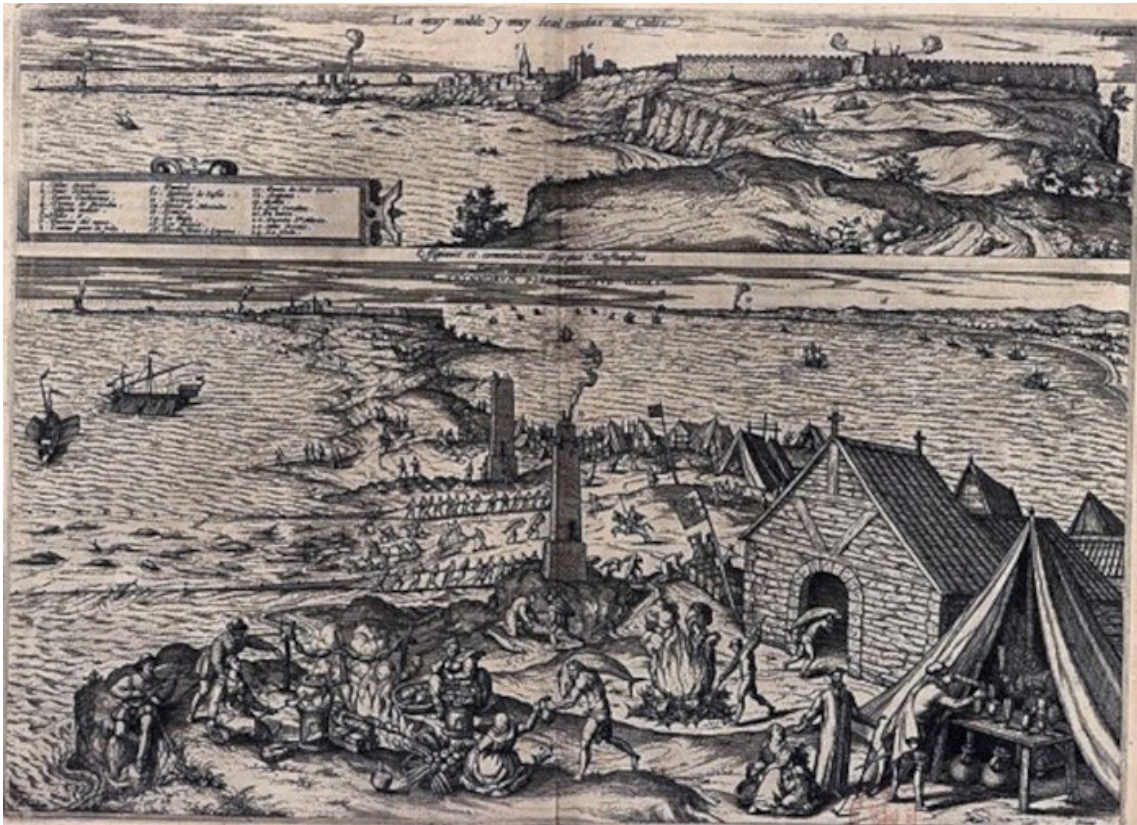
Ilustración 3. Grabado de la almadraba de Cádiz, de Joris Hoefnagel (ca. 1565). A la derecha, abajo, un jesuita.