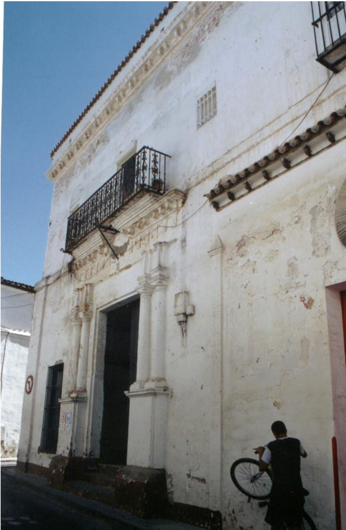
Ilustración 5. Antiguo colegio jesuita de Sanlúcar de Barrameda